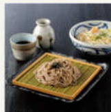
濃厚うどん・塩梅そば詰め合せ 50g×10食