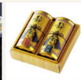
藤岡株式会社合せ 抹茶入り五米茶・煎茶 計2缶