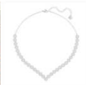
<スワロフスキー> Argentoスクエアネックレス