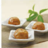
はちみつ餡子 (糖分約4%) 700g