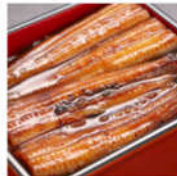
浜松・浜名湖うなぎ蒲焼 2人前