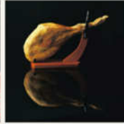
ハモンセラーノ (生ハム) セット 8kg