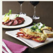
<リノグ> 信濃牛チリカ2種とオマール両巻