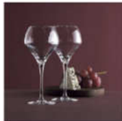
<シェフ&ソムリエ> ワイングラスセット