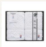
<花小紋> 今迄布アイトタオル2枚セット