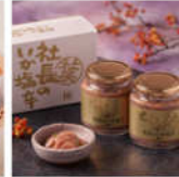
社長のおいしさ 糖 (きりみ) 200g×2個