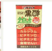
はちみつ黒糖ダイエット宅配用 125ml×36本