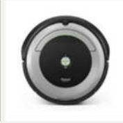
<Robot> ロボット掃除機ルンバV690