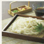
手塩味噌うどん 150g×10束