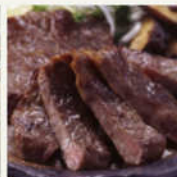
米沢牛焼肉こだわり盛り 4枚