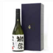
【日本酒・16度】 別荘 暮まその光へ 純米大吟醸 720ml