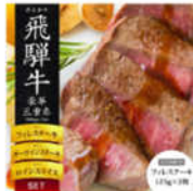
飛騨牛 飛騨牛の豪華な豪華！フィレ (250g)、 サーロイン (500g)、ロインステーキ (500g) と人気の部位が楽しめるセット