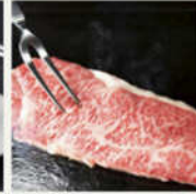
<新潟・青森> 新潟産 サーロインステーキ (180g×4 枚) & リブロースステーキ用肉 (840g)