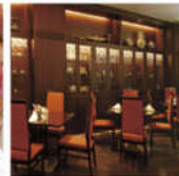
<東京・銀座・赤坂> 高級個室 ペアディナーご利用券