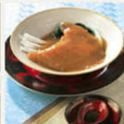
<東京・日本橋区船町> ふかひれ巻物 3かひれ150g×2枚