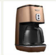
<宇ロンネ> デイズティンタコレクション ドリップコ ーヒーメーカー スタイルコッパ ICM10111-CP