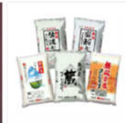
新選米食べ比べセット 2110kg