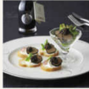
和食グルメセット