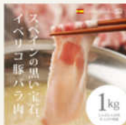
イベリコ豚バラ肉 焼・しゃぶしゃぶ用ス ライス 1kg