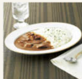
<キッチン飛騨> 高級菜鳥と牛ヒレフカレー中華 290g×2食