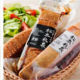
まっくら菓房 (400g) とベーコン (300g) のギフトセット