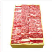
米沢牛カルビ焼肉用 480g