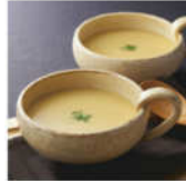
<福島正八> クリームコーンスープ 8缶