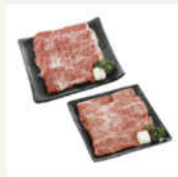
松阪牛・神戸ビーフ 食べ比べつき焼肉